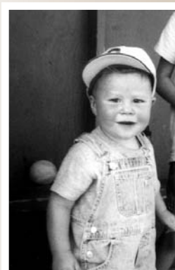
Une journée pour petits et grands.