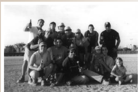
Les membres de l'équipe Pothier Delisle peuvent être fiers de leur journée! Qui sait... peut-être l'an prochain?!