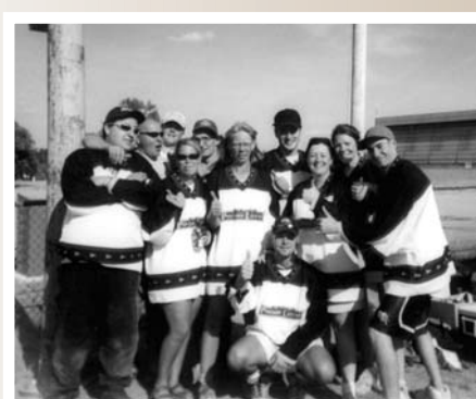
L'équipe de Pouliot L'Écuyer est demeurée dans la course jusqu'à la fin!!