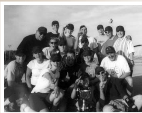
L'équipe Lavery de Billy exhibant fièrement le trophée Gagnon, Sénéchal, Coulombe.

B ien que le tournoi ait eu lieu au début septembre, bien que des nuages laissaient présager de bien mauvaises nouvelles, force nous est de constater que le beau temps est toujours de la partie pour cet événement.